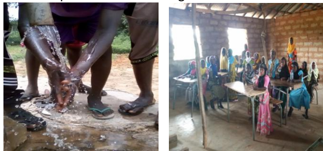
Des missions de terrain pour le suivi des actions

SOS CASAMANCE envoie régulièrement des bénévoles et des volontaires en mission de service civique. Leurs missions :