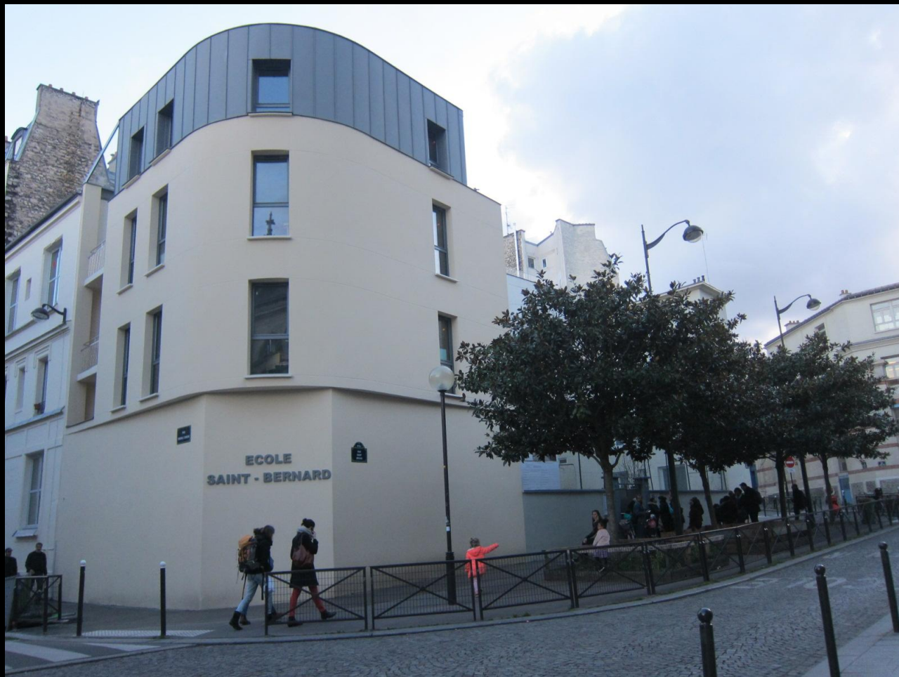
C'est rare une école aussi belle dans le quartier