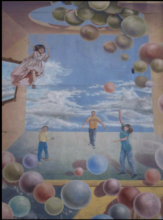
Une peinture / On dirait un rêve / C'est la fête