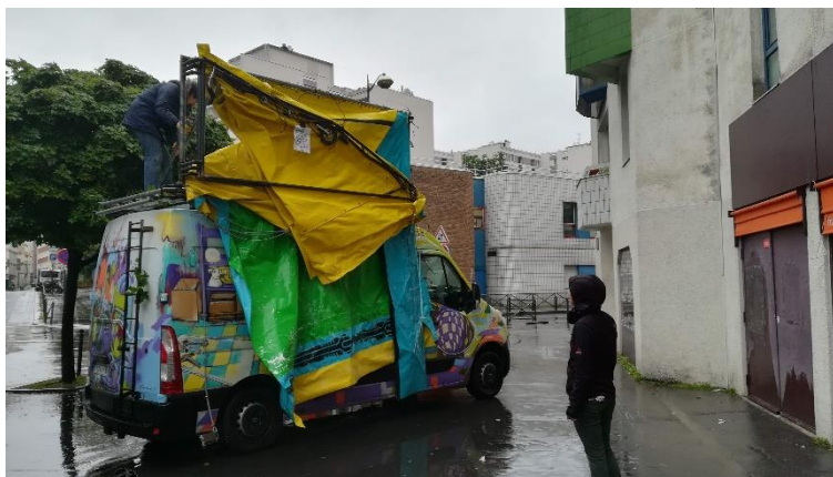
Chapiteau en cours de déploiement à Mac Orlan le 5 novembre 2019

Le chantier du chapiteau aura duré 5 mois. Il est fin prêt à être ouvert dans les résidences sociales lors des animations.