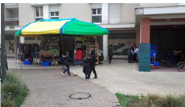
Villiers-sur-Marne le 1 er novembre