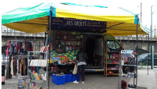
Saint-Denis le 13 septembre

Les dernières actions se déroulent à Villiers Sur Marne, Saint Denis, et sur les trois territoires du XVIII e arrondissement de Paris.